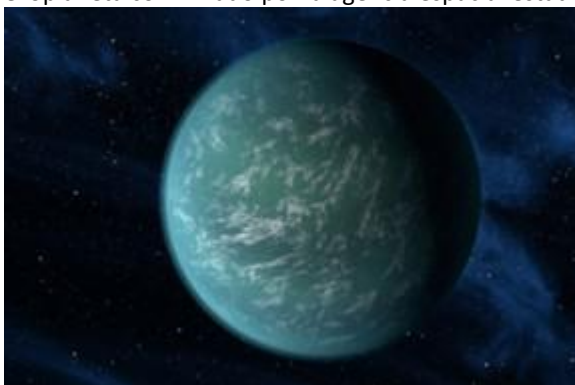
Imagen: Ilustración Kepler 22b | NASA

Kepler 22b, detectado por primera vez en 2009 y ubicado a unos 600 años luz de la Tierra, es el primer exoplaneta confirmado por la agencia espacial estadounidense como apto para la vida.